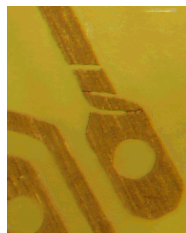
Abbildung 4: Unterbrochene Leiterbahn durch Verkratzen

Doppelseitige Platinen sollte man mit einem geeigneten Werkzeug (z.B. die Plastikpinzette) aufbocken, sodaß die Ätzzlösung auf beide Seiten gelangen kann. Vorsicht beim Umgang mit der Platine: durch Kratzen über die Oberfläche kann sich der ehemals durch das Layout geschützte Photolack noch immer ablösen. Das Resultat zeigt das Foto in Abbildung 4. Am besten läßt man bei den Layouts einen Rand stehen, an dem man später die Platine anfassen kann.